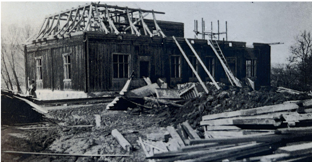
Thorbjørnrud bygges om i 1911.