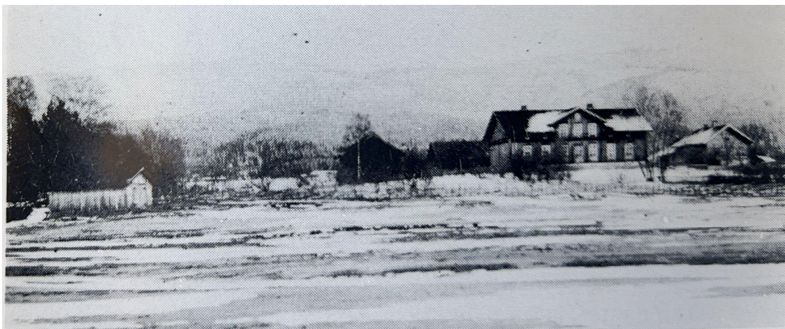
Thorbjørnrud vest, 1890.