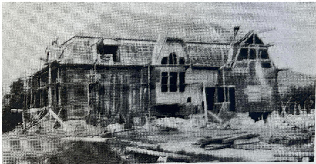
1911 Thorbjørnrud bygges om.