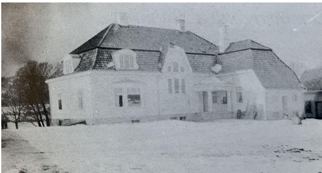
1912 Thorbjørnrud ombygget - øst.